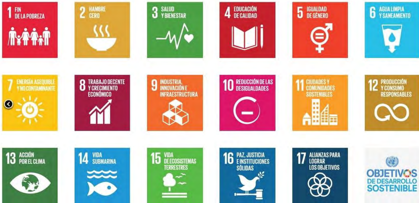
Tabla de Objetivos de Desarrollo Sostenible.