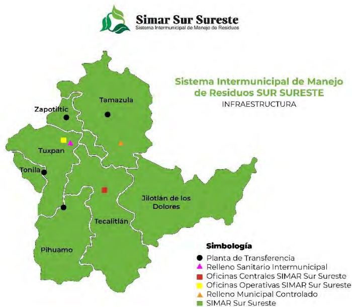
Mapa 1. Municipios que integran el organismo operador Sistema Intermunicipal de Manejo de Residuos Sur Sureste

El Sistema Intermunicipal de Manejo de Residuos Sur Sureste SIMAR Sur Sureste , es un organismo público descentralizado (OPD), encargado de planear, gestionar y administrar infraestructura común para la prestación de los servicios públicos de limpieza, recolección selectiva, transferencia, acopio, tratamiento y disposición final de residuos sólidos, así como diseñar e implementar políticas públicas de manera intermunicipal para la prevención, reutilización, valorización y aprovechamiento de subproductos por medio de la aplicación de las tres erres (reducir, reutilizar y reciclar) en términos de los establecido por la legislación nacional vigente.